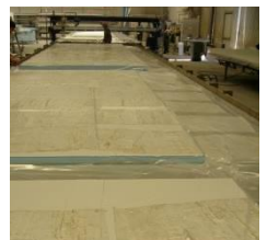
Paneles en vacio