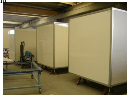
Cuerpos de camiones refrigerados listos