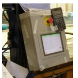
Tablero de contro secundario en el sistema de distribución de viaje