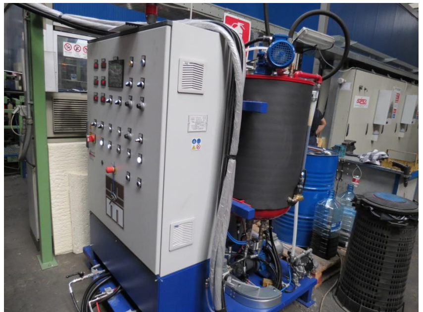
Máquina dosificadora en línea de panel sandwich de PIR