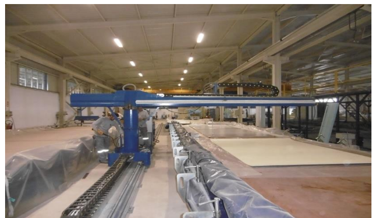
Rotante. Planta diseñada cuando las planchas estan posicionadas en dos filas lado a lado. Largo hasta 120 mt