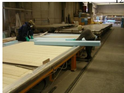
Posicionamiento de paneles aislantes