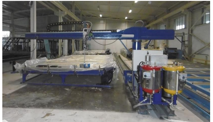
Rotante con unidad de dosificación móvil. Planta diseñada cuando todas las planchas estan posicionadas en dos filas lado a lado y la unidad de dosificación esta viajando. Largo hasta 120mt