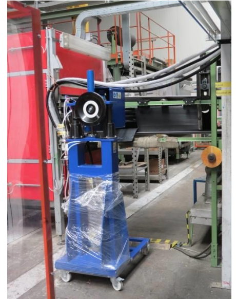
Sistema de dispensado en línea