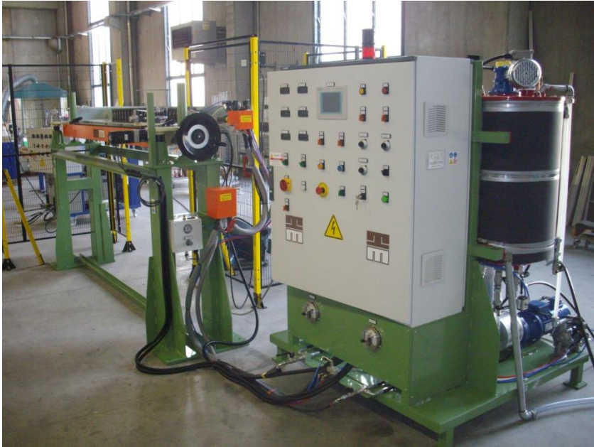
Máquina de dosificación y dispensador

Sus pequeñas dimensiones permiten posicionar fácilmente aun lado de una línea de producción. La posibilidad de estar equipado con mangueras largas (hasta 120 mt) permiten usar una máquina diferentes líneas. Las dimensiones altamente reducidas del Sistema de distribución permiten dispensar incluso en espacios estrechos