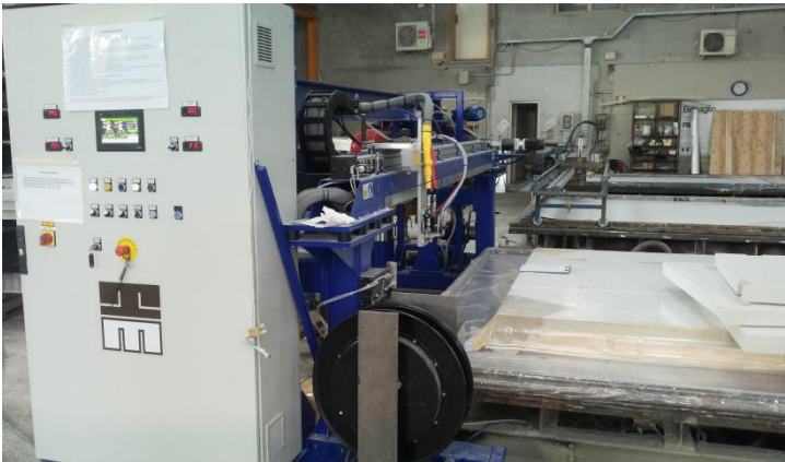
Todo a bordo. Planta diseñada cuando muchas planchas estan posicionas uno al lado del otro. Unidad de dosificación a bordo de la distribución transversal.