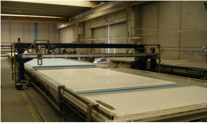
Derecho. Planta diseñada cuando las planchas están posicionadas en línea unica Largo hasta 120 mt