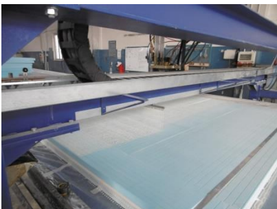
Distribución por poker