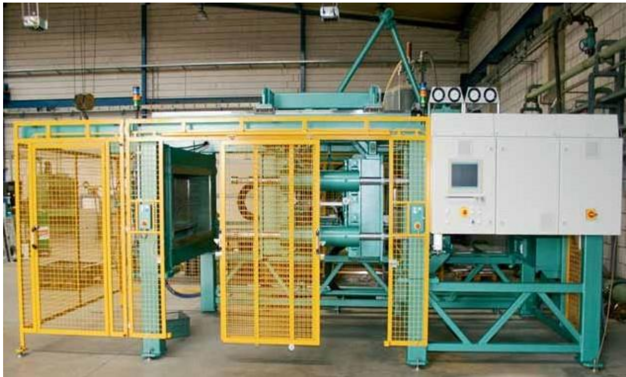
Ilustración: HEITZ HOZ DUO 1208 antes de la entrega